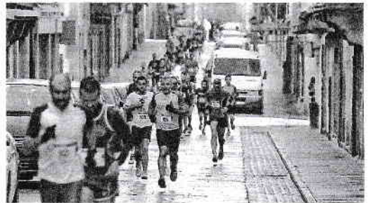
La prueba discurre por el barrio de A Magdalena. JOSÉ PARDO

Los interesados en tomar parte en esta actividad pueden anotarse en la página web www.carreirasgalegas.com . Es totalmente gratuita, aunque el plazo para anotarse finaliza a las diez de esta noche. Los orga-